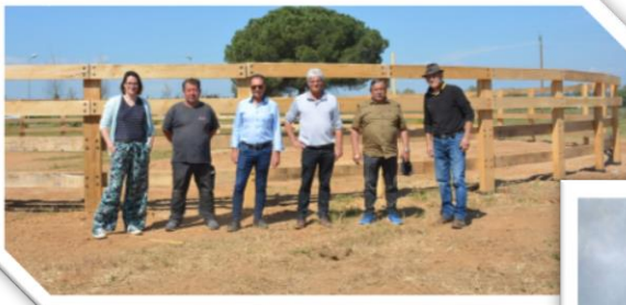
Parc public autour des cultures camarguaises à Aubord