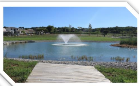
Parc de l'Espérian à Vauvert