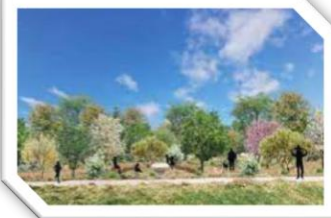
Création d'une forêt urbaine à Calvisson