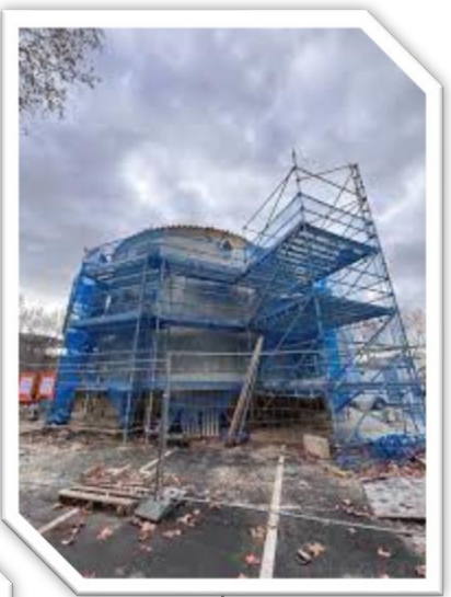
Eglise de Saint-Laurent d'Aigouze