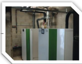
Chaufferie bois du gymnase de Lunel-Viel