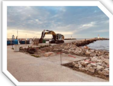
Môles du Grau-du-Roi