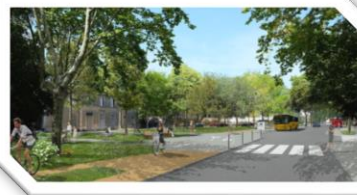
PEM de Vergèze-Codognan et de Vauvert