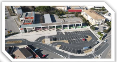
Réfection du parking du Lycée Louis Feuillage à Lunel