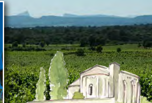
LA CHAPELLE SAINT-JULIEN - A2