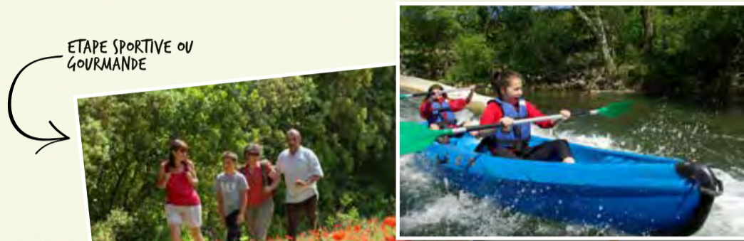
ETAPE SPORTIVE OU GOURMANDE