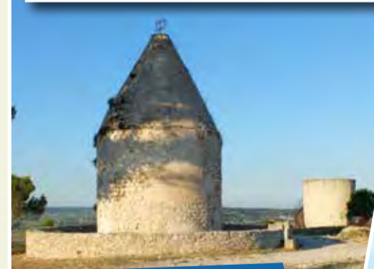
LES TROIS MOULINS DE CALVISSON - C3