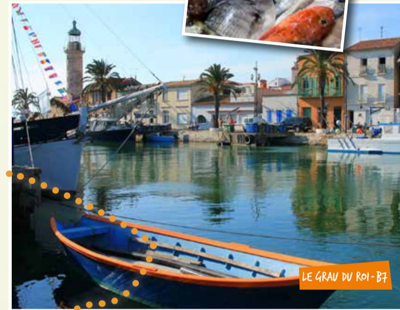
LE GRAU DU ROI - B7