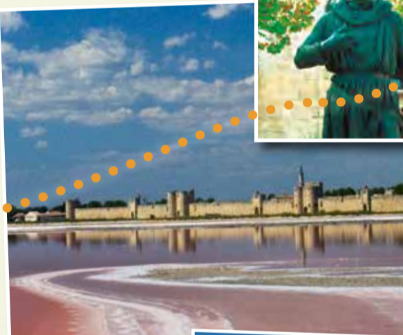
SALINS ET REMPARTS D'AIGUES-MORTES - C6