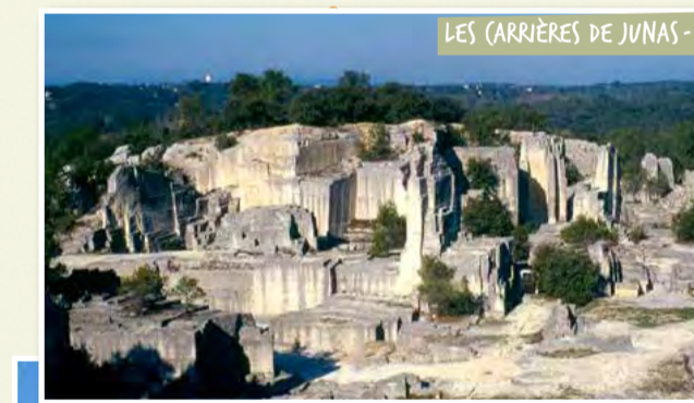
LES CARRIÈRES DE JUNAS - B3