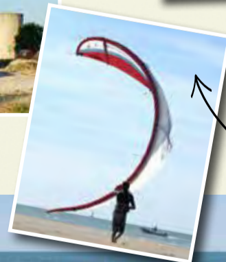
PLAGE DE L'ESPIQUETTE