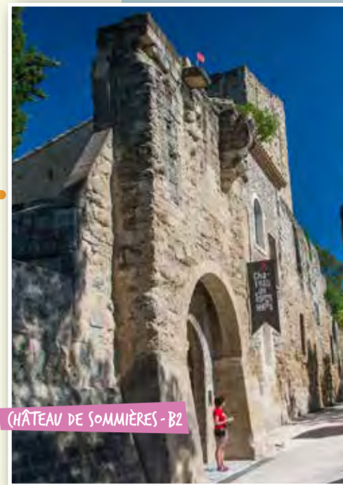
CHÂTEAU DE SOMMIÈRES - B2