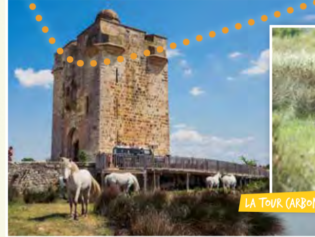
LA TOUR CARBONNIÈRE - C5